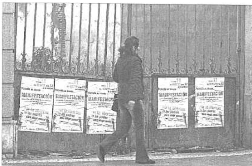
Los organizadores de la manifestación del sábado han pegado decenas de carteles en Pozuelo de Alarcón.

La actual Ley de Educación, que se tramita en el Senado, señala en