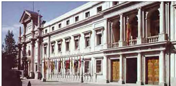
Imagen del Palacio del Senado

regionales del PP, con sus argumentos apocalípticos sobre el futuro de España, sino que tam-